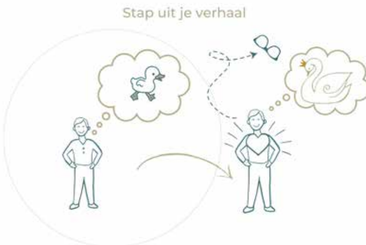
Figuur 1. Ontdek wie je bent zonder je beperkende overtuigingsbril

“We stappen dan heen en weer tussen kijken met de bril op en met de bril af. Dat blijkt een wereld van verschil. Mensen ervaren hoe dichtbij vrijheid is. Dat er eigenlijk geen afstand is; dat het er echt om gaat vanuit welk perspectief je waarneemt en hoe je houding is. Houding is overigens het tweede kenmerk van vrij leiderschap. We doen veel oefeningen waarbij mensen zowel fysiek, energetisch als op theoretisch niveau gaan herkennen en ervaren wat het verschil is tussen vrij zijn en onvrij zijn.”