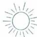
Figuur 2. De zes kenmerken van vrij leiderschap

Bewustzijnsontwikkeling is nooit af. Het is belangrijk om tijd te nemen voor reflectie, oefening en onderhoud. Zo leer je om steeds opnieuw je zwaartepunt te leggen in vrijheid. Als vrij leider ben je moedig en laat je je licht voluit stralen.